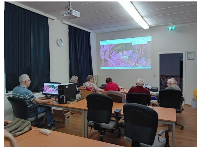
Im Computerclub für Senioren Leipzig im Werk II am Connewitzer Kreuz

Incl. USB-Stick mit vorgefertigten Mustern und Beispielen Pausenverpflegung und Getränken Unkostenbeitrag 10,00 EUR